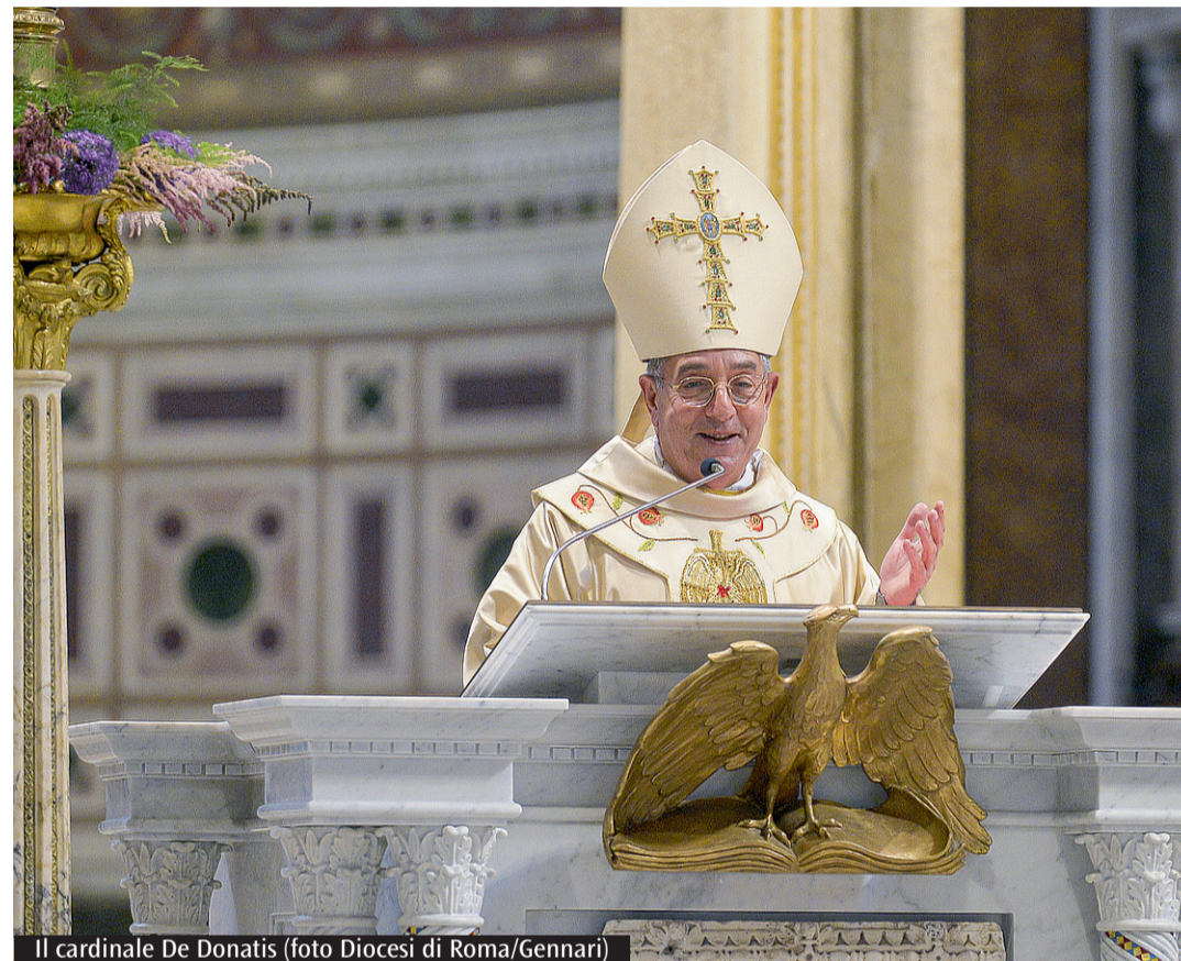
Il cardinale De Donatis

Sarà il cardinale Angelo De Donatis a presiedere la celebrazione eucaristica per le ordinazioni sacerdotali, sabato prossimo, 20 aprile, con inizio alle ore 18 nella basilica di San Pietro. Ad annunciarlo è il Consiglio episcopale della diocesi, in una lettera indirizzata mercoledì scorso ai presbiteri, ai diaconi e ai fedeli laici della diocesi di Roma. «Durante quel momento celebrativo - affermano i vescovi ausiliari - ringrazieremo il Signore per il generoso servizio di don Angelo alla nostra diocesi come cardinale vicario». Com'è noto, infatti, otto giorni fa il Papa lo ha nominato alla guida della Penitenzieria Apostolica, dopo quasi sette anni di ministero come vicario per la diocesi di Roma. Settanta anni compiuti il 4 gennaio scorso, originario di Casarano (Lecce), formatosi prima al Seminario di Taranto e poi al Seminario Romano Maggiore, De Donatis è stato ordinato sacerdote per la diocesi di Nardò Gallipoli il 12 aprile 1980. Direttore spirituale al Pontificio Seminario Romano Maggiore dal 1990 al 2003, parroco di San Marco Evangelista al Campidoglio dal 2003 al 2015