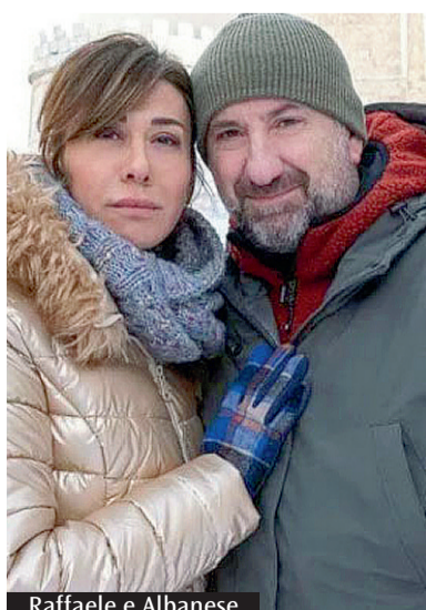
Raffaele e Albanese

Michele Cortese, insegnante in crisi con il proprio lavoro, ottiene il trasferimento da Roma in una scuola nel Parco Nazionale d'Abruzzo e arriva nel paesino indicato con tanta speranza... La situazione da cui prende il via Un mondo a parte , nuovo film di Riccardo Milani, in sala dal 28 marzo, affronta da subito uno dei tanti temi ostici nell'Italia contemporanea, quello dei piccoli centri, dei borghi che corrono il rischio di restare isolati. Nonostante tutto infatti, a dispetto di una tecnologia che ha aumentato le possibilità di espansione, è cresciuta nei contatti e nei collegamenti, ha fatto nascere punti di incontro inediti, nonostante questo appunto, permangono sul territorio zone che, quasi senza volerlo,