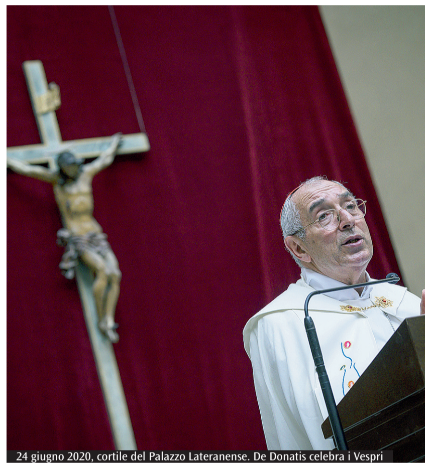
24 giugno 2020, cortile del Palazzo Lateranense. De Donatis celebra i Vespri

Medio Oriente, avvia le celebrazioni per i 1700 anni della basilica di San Giovanni in Laterano, inaugura il pastificio nel carcere minorile di Casal del Marmo, interviene al convegno per i 10 anni della Evangelii gaudium . Il 2024 inizia con l'incontro del Papa per il clero di Roma. E sempre per il clero De Donatis guida la liturgia penitenziale, invitando i sacerdoti a donarsi «a favore di tutto il popolo che ci è affidato». A febbraio rivolge una lettera ai romani a 50 anni dal celebre convegno diocesano sui «mali di Roma» auspicando una «città di tutti» e interviene alle catechesi quaresimali dedicate a Pinocchio. In marzo il cardinale guida la visita ad «limina» dei vescovi del Lazio, presiede la Messa nella Giornata in memoria delle vittime del Covid e la celebrazione per i funerali di monsignor Strazzari, che fu rettore del Redemptoris Mater. Subito dopo Pasqua, dal 2 al 5 aprile, il viaggio con un gruppo di sacerdoti in Ungheria: l'ultimo atto nella diocesi di Roma. Ancora con il clero, alla cui cura pastorale De Donatis ha dedicato larga parte del suo ministero: prima da padre spirituale, poi da vescovo ausiliare e quindi da cardinale vicario. Il giorno dopo il rientro in Italia, la nomina alla guida della Penitenzieria Apostolica, il più antico Dicastero e il primo dei Tribunali della Curia Romana. Sabato 20 aprile lo attende il saluto della comunità ecclesiale della diocesi di Roma nella basilica di San Pietro.