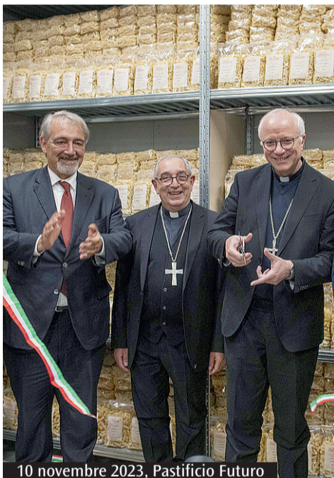
10 novembre 2023, Pastificio Futuro

Impossibile ripercorrere i tanti eventi che hanno visto protagonista il cardinale De Donatis nei quasi sette anni del suo «generoso servizio» da vicario del Papa per la diocesi di Roma, ma possiamo scandire cronologicamente alcuni momenti a partire da quel 29 giugno 2017 in cui ha iniziato il suo ministero episcopale come più stretto collaboratore di Francesco per la Chiesa di Roma. Nel 2018, davanti al clero di Roma che dal settembre 2015 aveva già seguito da vescovo ausiliare, De Donatis illustra le tappe del percorso che attende la comunità ecclesiale diocesana negli anni successivi, a cominciare dall'anno dedicato alla memoria e alla riconciliazione. È il tempo in cui la Chiesa di Roma viene coinvolta in un esercizio collettivo sulla memoria degli ultimi 50 anni e dei suoi frutti, in cui si inserisce anche una collana di libri su alcuni ambiti fortemente voluta dal cardinale. De Donatis, nel tracciare il percorso, parla di una «settimana di anni», quelli che separano dal Giubileo del 2025, e indica il Libro dell'Esodo come paradigma di questo itinerario e come filo conduttore la