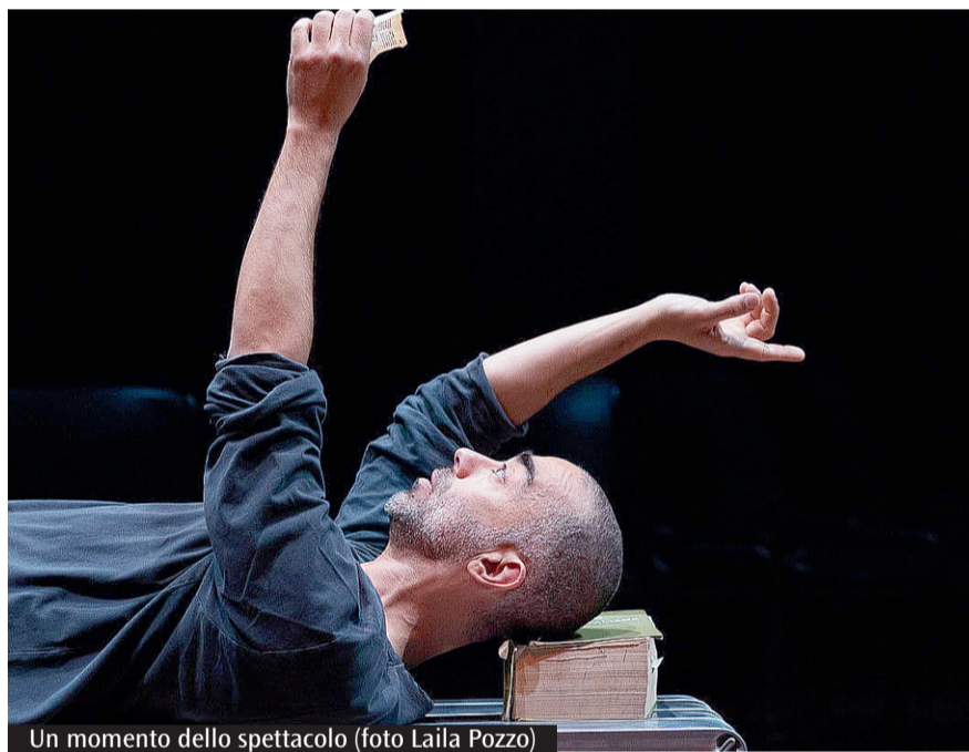
Un momento dello spettacolo

alcune lettere una traccia dei suoi pensieri più intimi, che dimostrano la sua capacità di uscire dall'isolamento. Il progetto non solo mette in risalto il disagio sociale di chi si sente isolato, ma fa apparire i due aspetti del linguaggio umano: il primo come strumento di alienazione, il secondo come strumento di dialogo portatore di senso». Un'opera teatrale, dunque che esplora fino in fondo il tema dei senza dimora i quali, oltre a non avere una casa spesso non hanno più né voce, né identità e mette in luce come le nostre grandi città abbiano un effetto spersonalizzante e di espulsione del povero. E se Sami, che essendo poeta ha mantenuto una relazione con la parola grazie alla scrittura, ce ne sono tanti altri come lui che vivono nell'isolamento. A Roma sono 22mila.